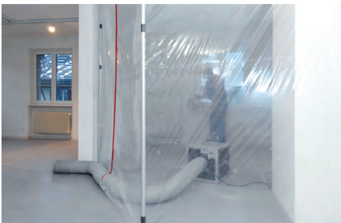
Staubwand mit Luftreiniger und Reissverschluss

Dieser saugt die staubige Luft an und trennt mittels Filter (HEPA 13) sämtlichen Staub ab. Die saubere Luft blasen wir mit einem Schlauch in die