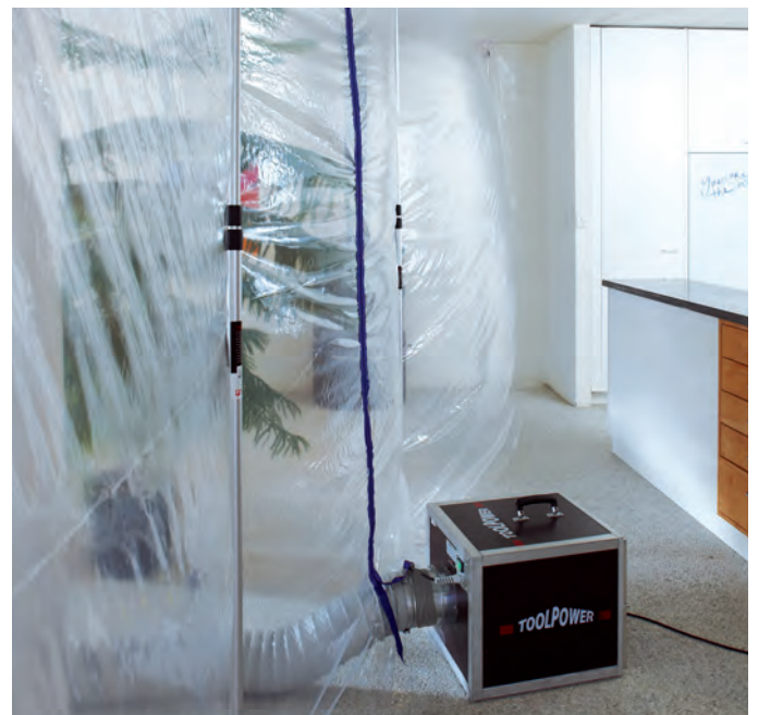
Staubwand mit Ausbuchtung Richtung Baustelle: Überdruck Wohnung, Unterdruck Baustelle.

bere Luft der Wohnung auf die Staubwand und fliesst durch eventuelle Öffnungen wieder zurück in die Baustelle.