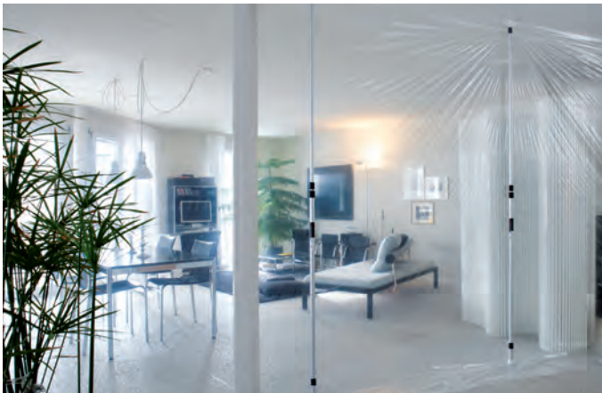
Staubwand ohne Reissverschluss

Mit den ToolPower-Staubwandstangen und Plastikfolien erstellen wir eine Schutzwand und trennen so die Baustelle vom Rest der Wohnung ab. Wir stellen einen Luftreiniger in die Baustelle.