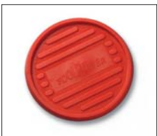
Plaqué anti-glisse No. d'art. 321050/103