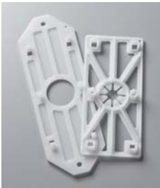
Tête No. d'art. 321050/102