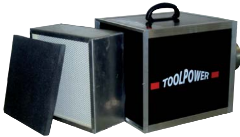
ToolPower TP 1060 Staubfänger-Luftreiniger Ventilator-Leistg. 1060 m 3 /h Art. Nr. 321050/10