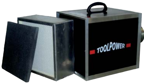
ToolPower TP 1060 Staubfänger-Luftreiniger Ventilator-Leistg. 1060 m 3 /h Art. Nr. 321050/10